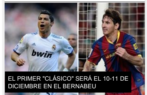
EL PRIMER "CLÁSICO" SERÁ EL 10-11 DE DICIEMBRE EN EL BERNABEU