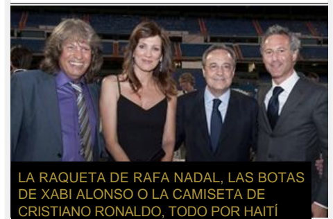
LA RAQUETA DE RAFA NADAL, LAS BOTAS DE XABI ALONSO O LA CAMISETA DE CRISTIANO RONALDO, TODO POR HAITÍ