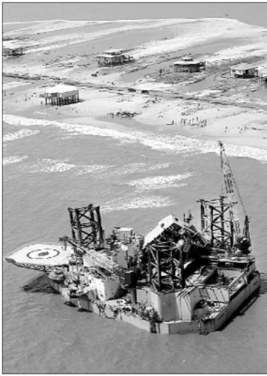
Una plataforma del golfo de México tras el Katrina.

Los huracanes reducen la capacidad de tratamiento de crudo en EE UU, que no ha construido refineras en 30 años