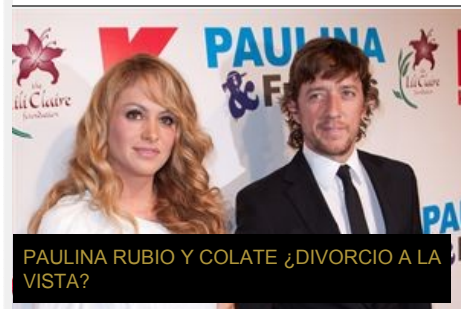
PAULINA RUBIO Y COLATE ¿DIVORCIO A LA VISTA?