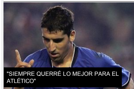
"SIEMPRE QUERRÉ LO MEJOR PARA EL ATLÉTICO"