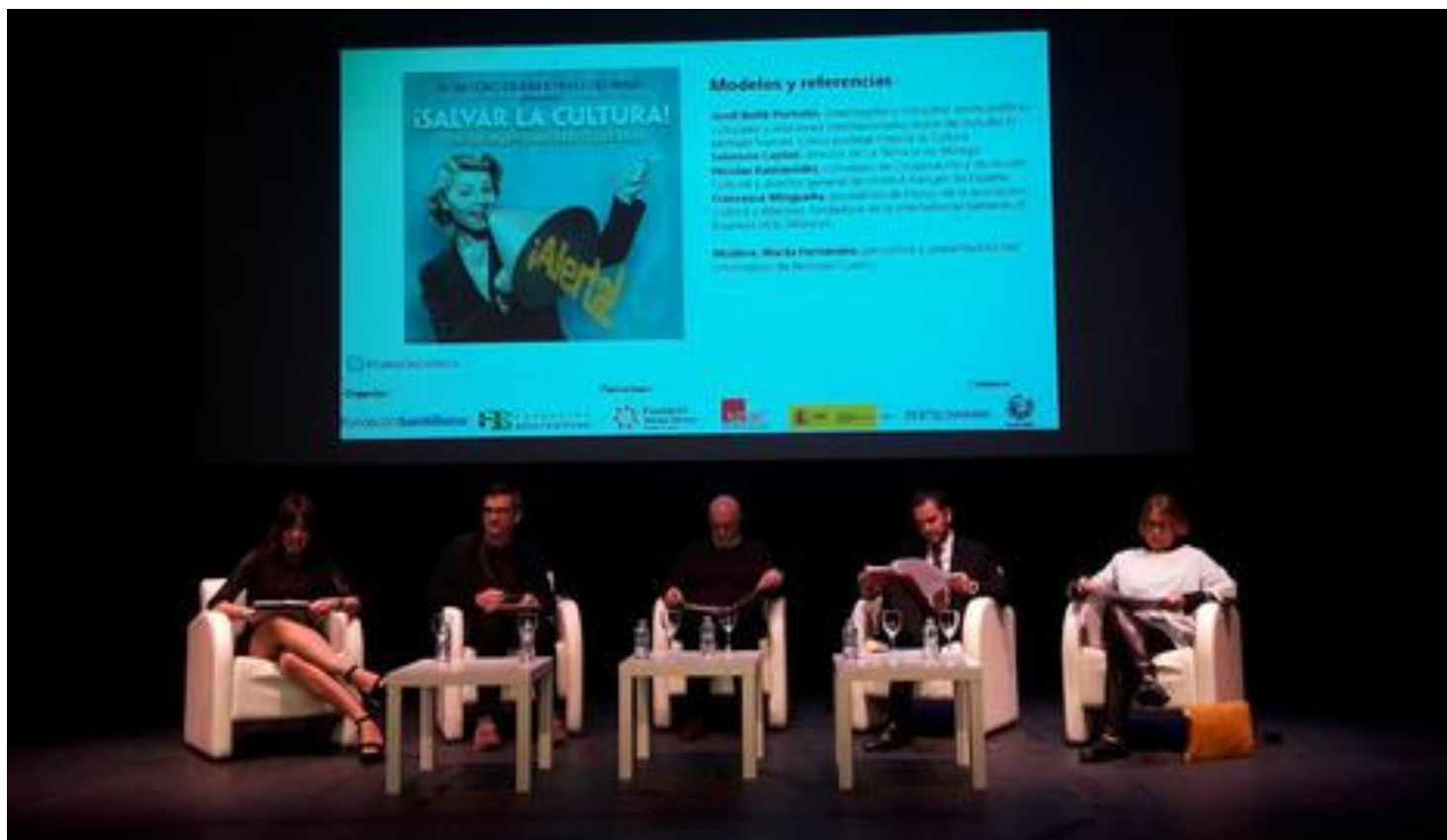
Una imagen del Foro de Industrias Culturales.