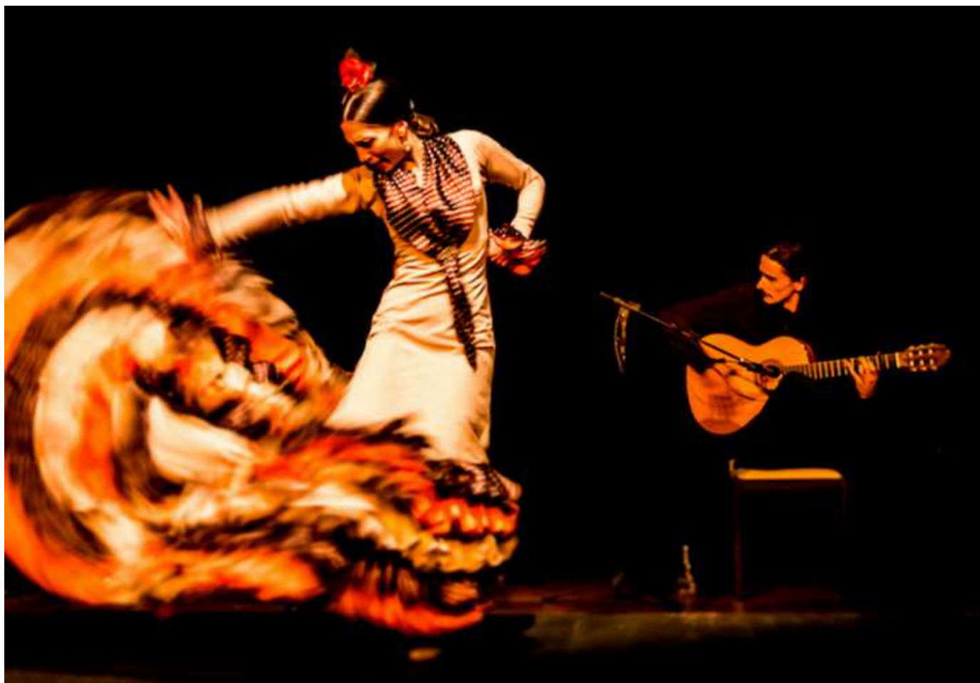
Bailarina de flamenco y músico.