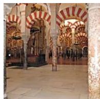
Un experto en terrorismo tacha de "insensatez" la