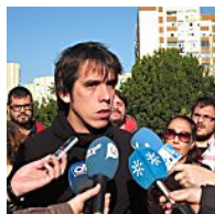
Dimite el secretario general de Podemos Málaga