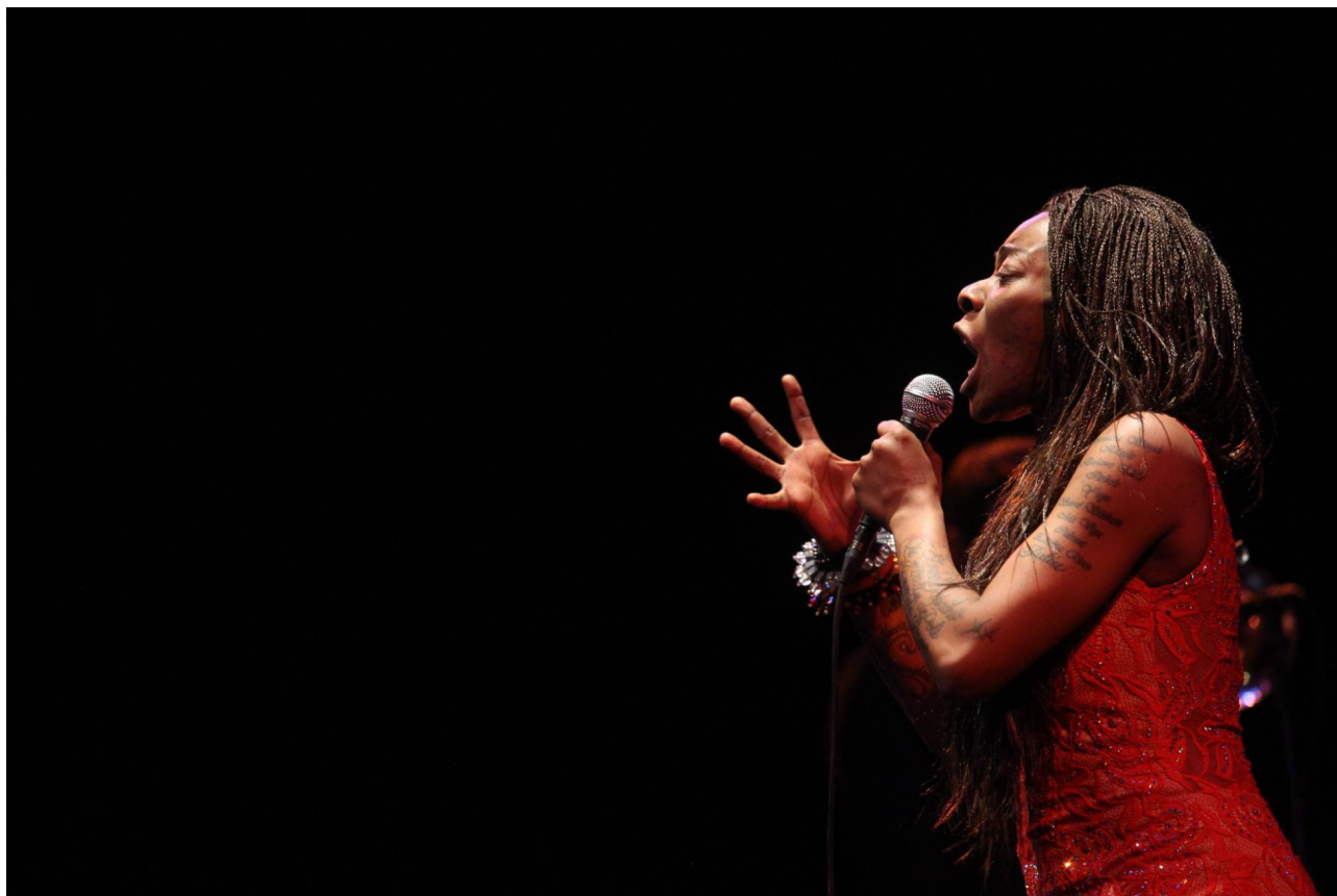
La cantante española Concha Buika.

Si un periódico se nutre en general de malas noticias, irregularidades y anomalías, de las heridas y cicatrices de la sociedad, el área de cultura suele dar un respiro. Ahí viven las buenas noticias: la creación, el surgimiento de nuevos autores o novedades de otros consolidados que pueden acompañarnos en el trance. Pero esta semana, esta zona generalmente tan reparadora se ha apuntado también al carro de las malas noticias. Y lo ha hecho porque un Informe sobre el estado de la cultura de la Fundación Alternativas recoge un suspenso decepcionante en la cuestión.