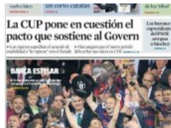
Primeras páginas de los diarios llegados esta noche a nuestra redacción