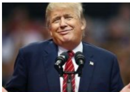
Trump, más cerca de ser candidato tras lograr el 76% de apoyos en Washington