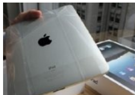
¿Lo has probado? Tiendas no quieren que descubras el curioso truco para comprar online Publicidad