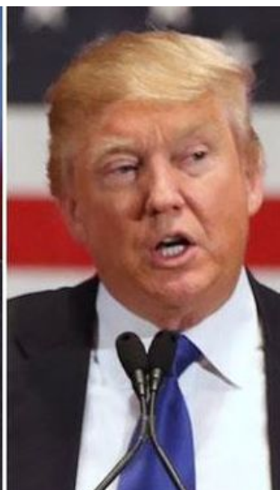
Cómo será EEUU bajo Clinton, Trump o Sanders

TRABAJA CON NOSOTROS BUSCAMOS PERIODISTAS