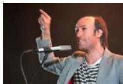
musical española por Navidad