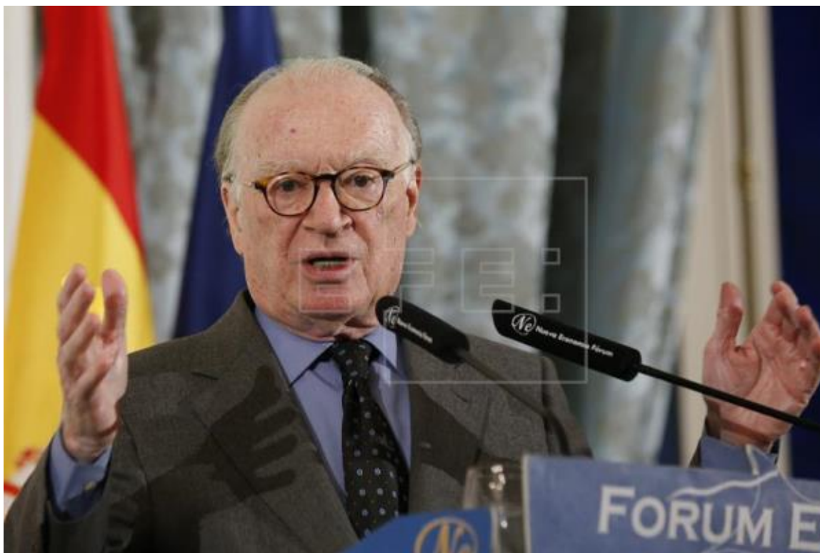
El vicepresidente ejecutivo de la Fundación Alternativas, Nicolás Sartorius, en un acto.