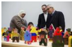
servicio para la comunidad"