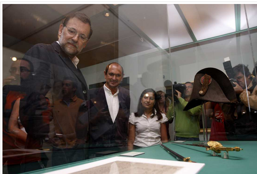
El presidente del Gobierno, Mariano Rajoy, en el Museo Provincial de Pontevedra en el 2009

El informe de la Fundación Alternativas remite al año 2015 cuando contabiliza el número de empresas: un total de 112.037