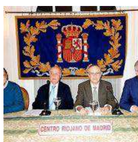
SE PRESENTA EN MADRID EL LIBRO 'LA SEGUNDA REPÚBLICA'