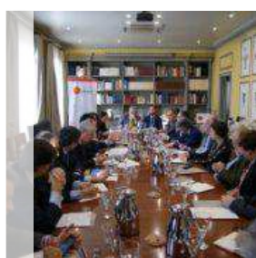
LA FUNDACIÓN ALTERNATIVAS AVANZA 40 PUESTOS Y SE SITÚA